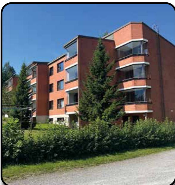
Töyrykatu 3 kerrostalo.

Ylitarjonta on seurausta väestörakenteen muutoksesta. Väestö